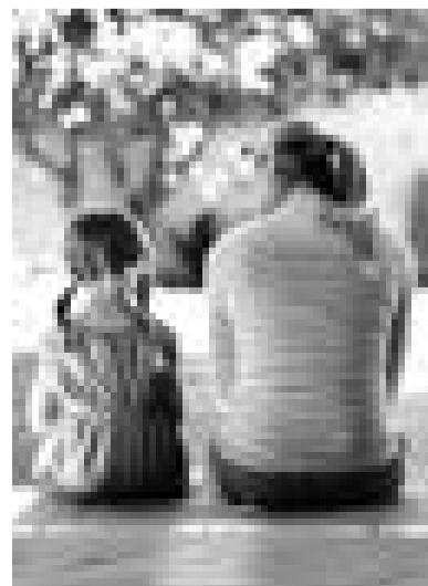
ции по опеке или попечительству, а в случае несогласия с его