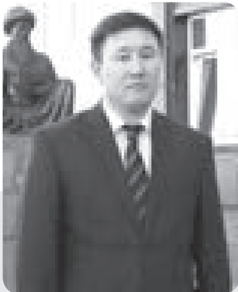
Азамат БУРАМБАЕВ, председатель суда №2 города Уральска

Если вас заинтересовал заголовок данной статьи, вероятно, вы ожидаете суда, и надеюсь, некоторые моменты и практические рекомендации из судебной практики внесут определенную ясность в вашу проблему.