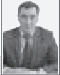
Ильяс КӨКІМ, председатель Специализированного следственного суда г. Кокшетау

Высшими ценностями государства является человек, его жизнь, права и свободы, отраженные во Всеобщей декларации прав человека. В Казахстане гарантируются права и свободы человека в соответствии с Конституцией РК. Именно закрепление в Конституции дает естественным правам человека поддержку и защиту в соответствии с законодательством.