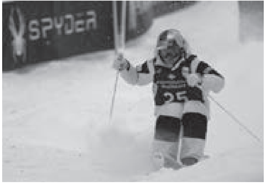
главный тренер команды Казахстана по шорт-треку.

Кроме того, во время самих Игр обитателям Олимпийской деревни предстоит ежедневно сдавать тесты на коронавирус, а их местоположение будут отслеживать по специальному приложению, установленному в мобильный телефон так же, как это было летом на Играх в Токио. Между тем в Национальном