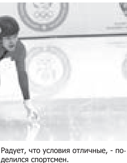
Радует, что условия отличные, - поделился спортсмен.

«Мы проживаем и тренируемся в «Алау». Кроме своей же команды, мы ни с кем не пересекаемся. Условия для жизни и тренировок отличные. Питание хорошее. Карантин на тренировочный процесс никак не влияет, скорее помогает сфокусироваться. Нам никто тренироваться не мешает. Правда, весь график состоит из маршрута «гостиница - лед - гостиница». Ходим все в масках. На улицу выходить нельзя. Пытаемся себя занять кто интернетом, кто книгами. Будем находиться здесь до самого вылета. В целом все хорошо.