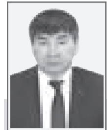
Малик ЖАРКЫНБЕКОВ, судья Актюбинского областного суда

Совершенствование защиты гражданина, юридического лица в его отношениях с публичной властью всегда было актуальным. Одним из способов повышения эффективности этой защиты является создание в Республике Казахстан полноценного института административной юстиции.