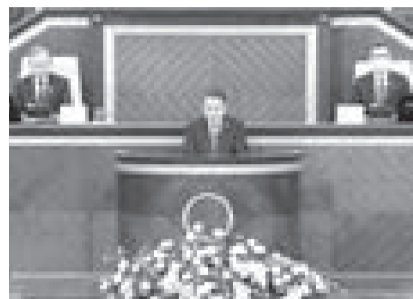
КЕҢЕС ЖОЛДАУЫ ЖАРИЯЛАНДЫ