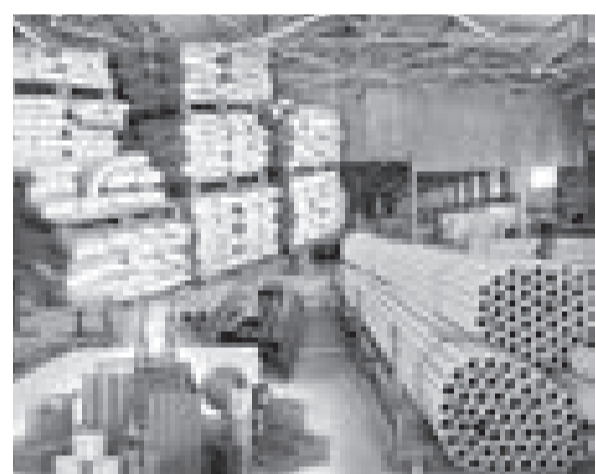
ҚЫМБАТШЫЛЫҚ ҚОЛДАН ЖАСАЛУДА