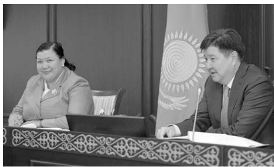
Председатель Верховного Суда Жакип Асанов провел очередное пленарное заседание высшего судебного органа. В его работе приняли участие председатели судебных коллегий и судьи Верховного Суда.