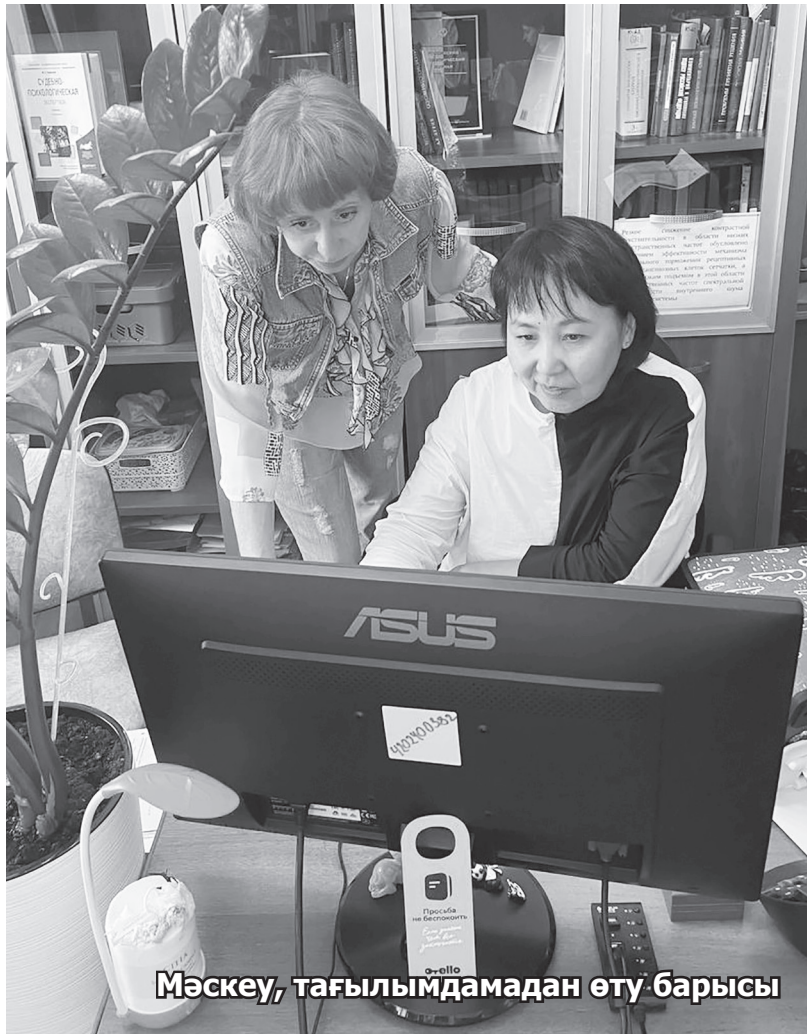
Мәскеу, тағылымдамадан өту барысы

Сот сараптамасы қазақ тілінде неге жүргізілмейді десек, Петропавл, Орал өңірінде өзге ұлт өкілдері, яғни, қазақ тілін меңгермеген мамандар отыр. Олар қорытындыны орысша жазады. Өйткені, заңда мынадай норма бар, сарапшы қай тілді білсе, сол тілде сөйлеуге құқылы. Сот оған аудармашы ұсынуы керек. Осыны сарапшылар өз пайдаларына жаратуда. Бір уақыттары бізде «қаулы қазақша келсе актіні де қазақ тілінде беріңдер» деген талап болған. Әрі бұл қатаң қадағаланды, сол уақытта барлығы қазақша жүргізілді. Ешқандай қиындық туған жоқ. Кейіннен қадағалау қалды, жұмыс бәз-баяғы қалпына түсті. Тіпті, қорытындыларда бас жағы мен аяқ жағы қазақша, ортасы мен